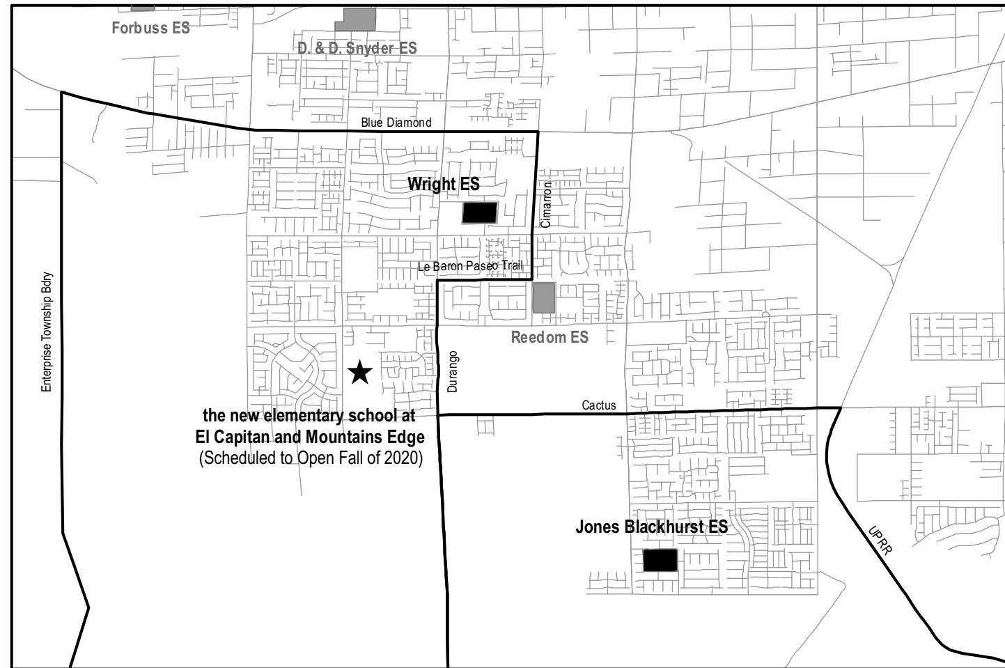
Attendance Boundaries for Jones Blackhurst ES and Wright ES extend south the Enterprise Township Boundary